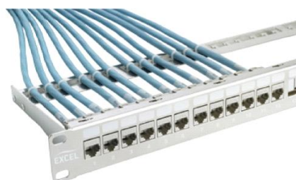
D. Moduły Keystone zamontowane w chromowym patch panelu - numer kat. 100-028