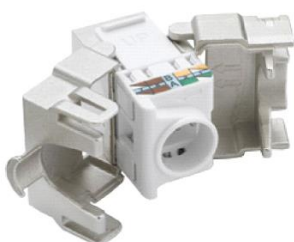
C. Widok z tyłu modułu Keystone z nałożoną nasadką