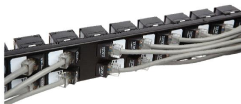
D. Moduły Keystone zamontowane w patch panelu kątowym