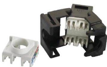
C. Widok z tyłu modułu Keystone z nasadką