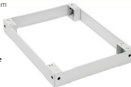
Cokół 100mm - poglądowe zdjęcie